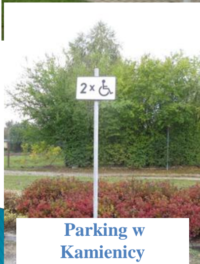
Parking w Kamienicy