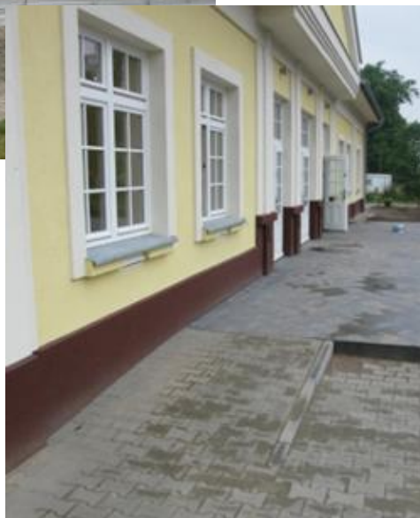
Sala wielofunkcyjna w Grylewie