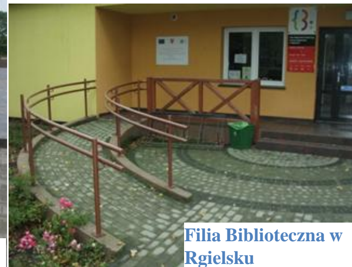
Filia Biblioteczna w Rgielsku