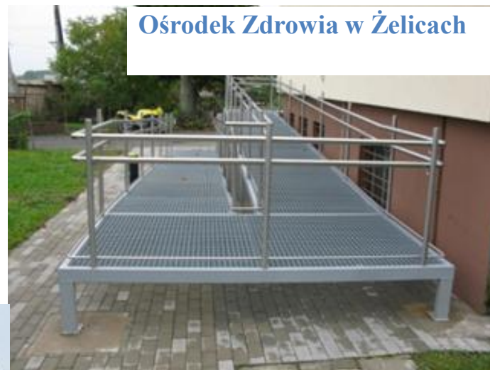
Ośrodek Zdrowia w Żelicach