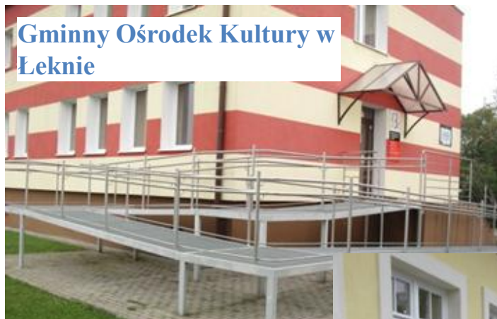
Gminny Ośrodek Kultury w Łeknie