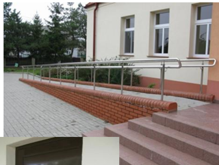
Gminne Centrum Rekreacyjno -Turystyczne w Kamienicy