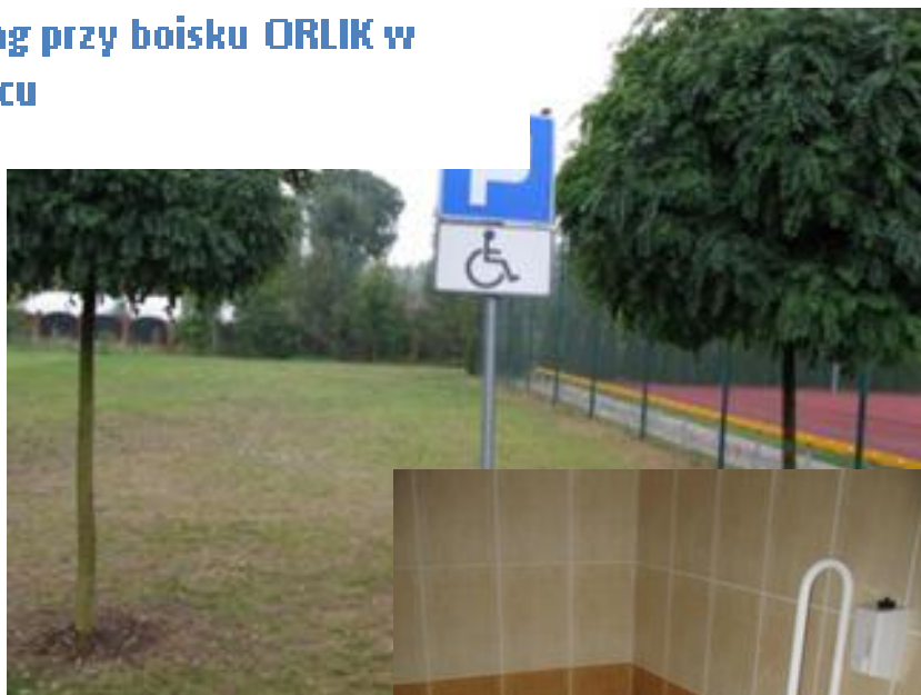
Parking przy boisku ORLIK w Kobylcu