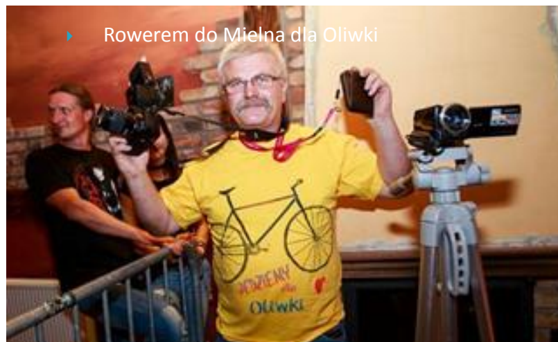
➤ Rowerem do Mielna dla Oliwki

WSPIERAMY AKCJE CHARYTATYWNE, STAŻE PRZY WSPÓŁPRACY Z POWIATOWYM URZĘDEM PRACY, ZATRUDNIENIE ORAZ INICJATYWY W RAMACH OTWARTYCH KONKURSÓW OFERT